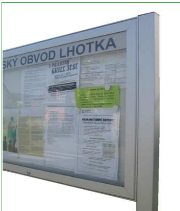
N20 - Informační vitrina, hliníkový rám, uzamykatelná

vitrina v min 1100 x š min 1400 x hl 40mm, min 24xA4, hliníkový rám v barvě elox, otevírání křídlo, nerozbitný karbonát Lexan, uzamykatelná přiloženými klíči, magnetická zadní stěna. Možnost upevnění na sloupky přikotvené k podlaze. Odolné vandalizmu. Spodní hrana ve výšce 900.